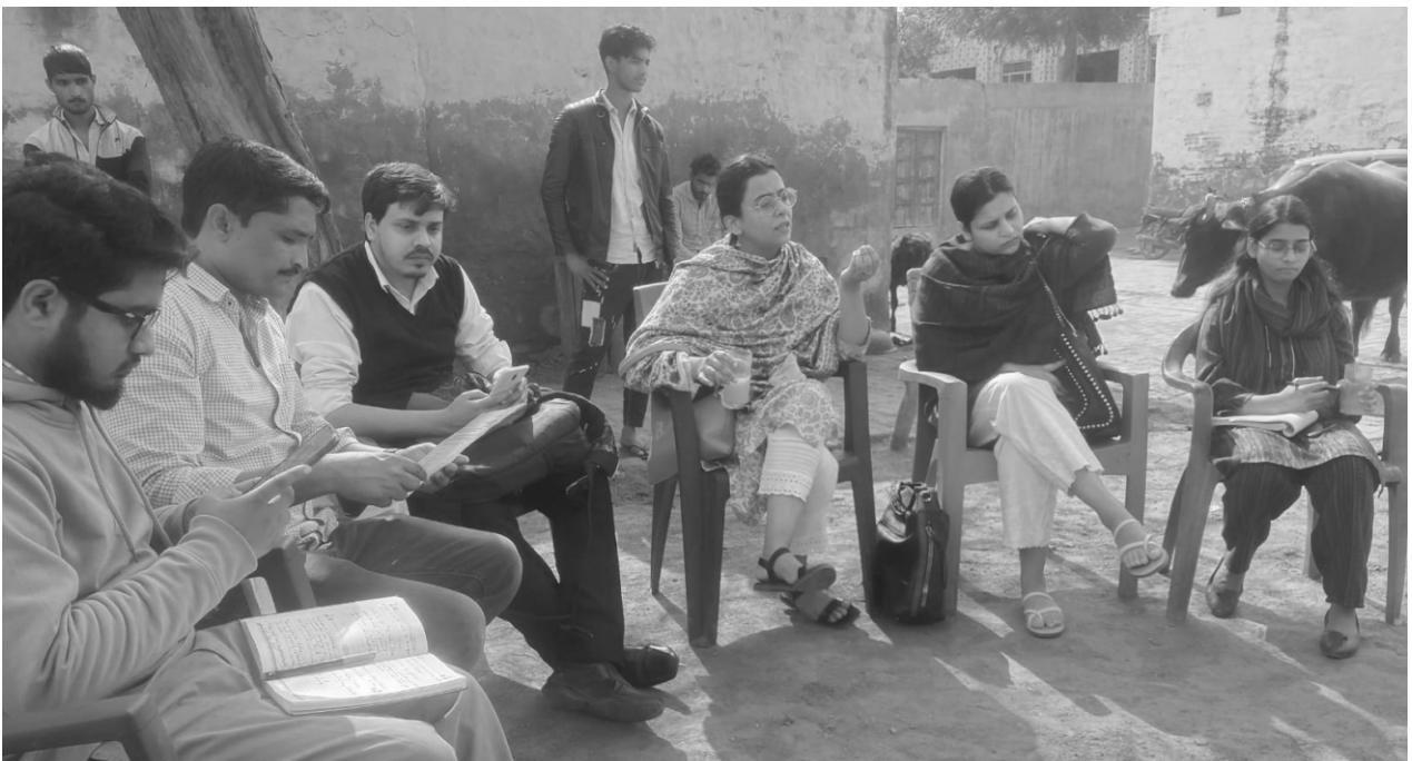
APCR Fact-Finding Team Members